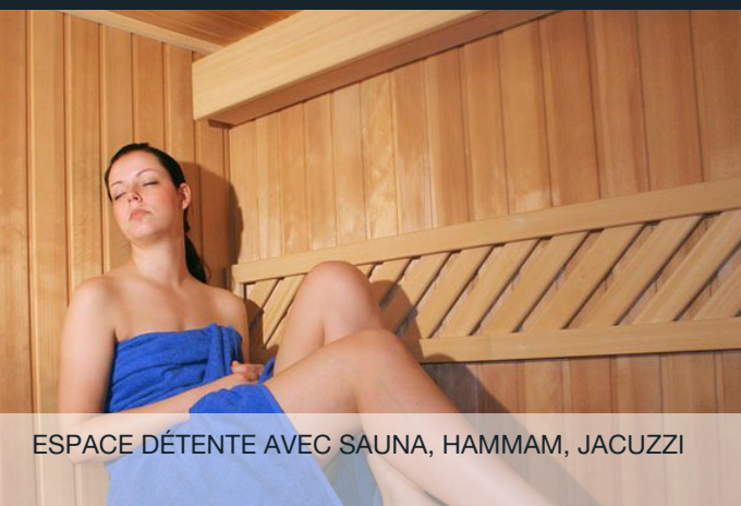
ESPACE DÉTENTE AVEC SAUNA, HAMMAM, JACUZZI